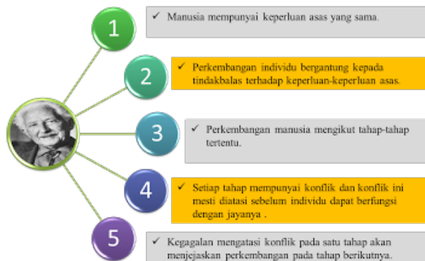
Rajah 2: Prinsip teori Erikson

Dalam kajian ini, teori kognitif sosial yang dikembangkan oleh Albert Bandura dirujuk sebagai model kajian. Berdasarkan teori ini, pembelajaran sosial melibatkan hubungan pengaruh tiga unsur iaitu persekitaran, individu (kognitif) dan tingkah laku. Faktor-faktor tersebut saling berinteraksi dan mempengaruhi pembelajaran. Manusia dilihat mempunyai keupayaan berfikir dan mengatur tingkah lakunya sendiri dan banyak aspek keperibadian melibatkan interaksi individu dengan individu yang lain. Personaliti dilihat sebagai sejumlah keseluruhan tingkah laku yang dipelajari serta menekankan bahawa manusia memainkan peranan yang aktif dalam menentukan tindakannya sendiri dan tidak semestinya bertindak secara pasif akibat pengaruh persekitaran dan menekankan kepentingan kognitif dalam personaliti.