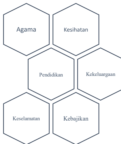
Rajah 2: Sektor yang mengalami perubahan sosial

Sebagaimana telah ditegaskan bahawa istilah perubahan sosial dan norma baharu mempunyai pertalian yang rapat. Maka perubahan sosial dalam konteks Malaysia akan diteliti daripada perbincangan norma baharu. Dalam hal ini, kajian mendapati perubahan sosial yang dominan telah berlaku terhadap beberapa sektor seperti keagamaan, kesihatan, pendidikan, hubungan sosial dalam keluarga, ekonomi, keselamatan dan kebajikan.